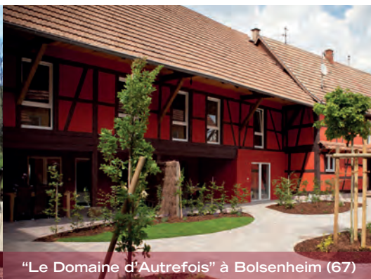
"Le Domaine d'Autrefois" à Bolsenheim (67)