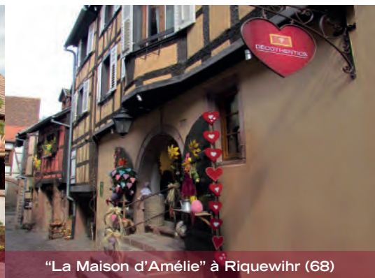
"La Maison d'Amélie" à Riquewihr (68)