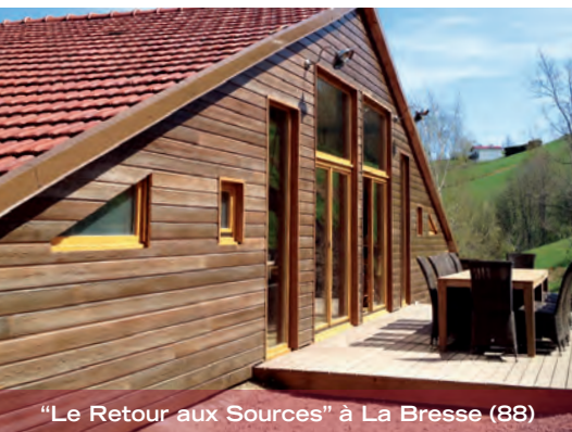
"Le Retour aux Sources" à La Bresse (88)